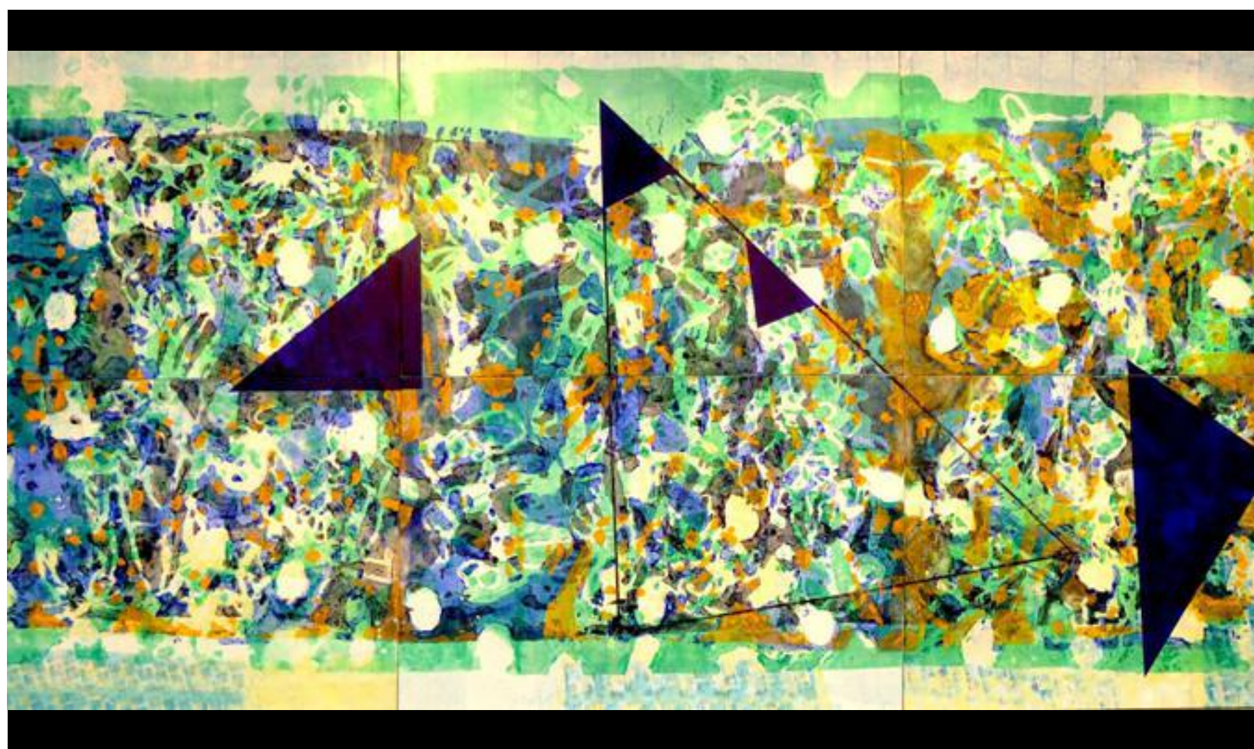
Una de las obras de la marroquí Nissrine Seffar que integran la exposición de la Fundación Tres Culturas.

ALEJANDRO LUQUE / SEVILLA / 16 DIC 2017 / 20:59 H - ACTUALIZADO: 16 DIC 2017 / 23:45 H.