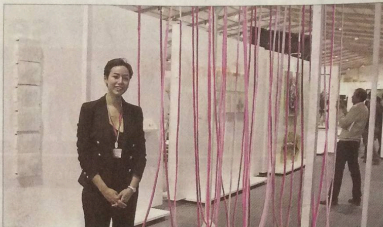
■ Une installation où, dans des tuyaux, coule de l'eau prélevée dans plusieurs mers du monde.

Les nouveaux acteurs du sport sont en train de dessiner une nouvelle économie, de nouveaux métiers, et de nouvelles opportunités de croissance. Désormais, c'est la société toute entière qui est impactée par ce mouvement. Comprendre ces mutations essentielles, anticiper leur évolution, telle est l'ambition du forum Quand le sport change la vie organisé par Le Monde et Thau aggro, vendredi 18 novembre, de 9 h à 17 h à Balaruc-les-Bains.